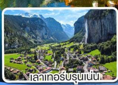
เลาเคอร์บรุนเนน