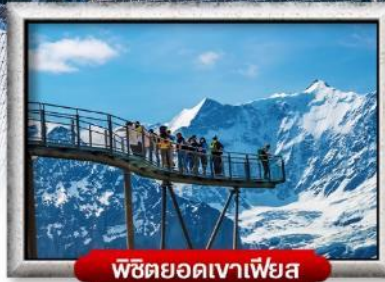
พิชิตยอดเขาเฟียส