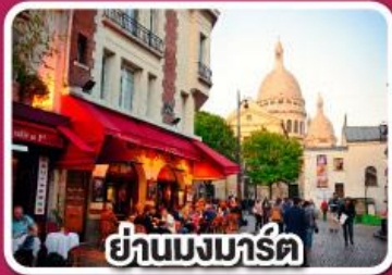
ย่านมงมาร์ต