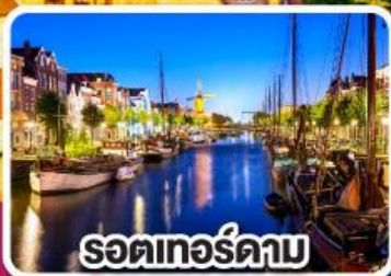
รอดเทอร์ดาม