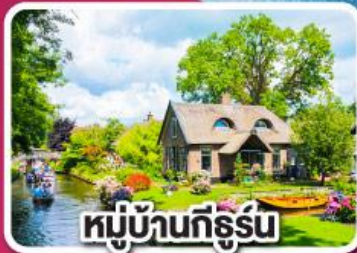
หมู่บ้านทีร์ูร์น

พักปารีสและอัมสเตอร์ดัม อย่างละ 2 คืน ไม่ต้องเปลี่ยนโรงแรมบ่อย