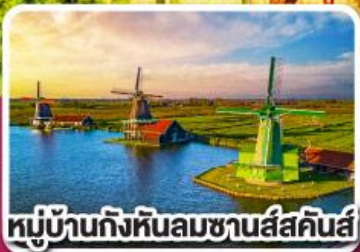
หมู่บ้านกังหันลมซานส์คินส์