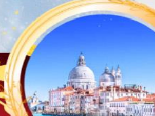
ล่องเรือสู่เกาะเวนิส