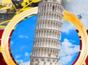
หออนปีซ่า