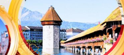
ลูซิิร์น