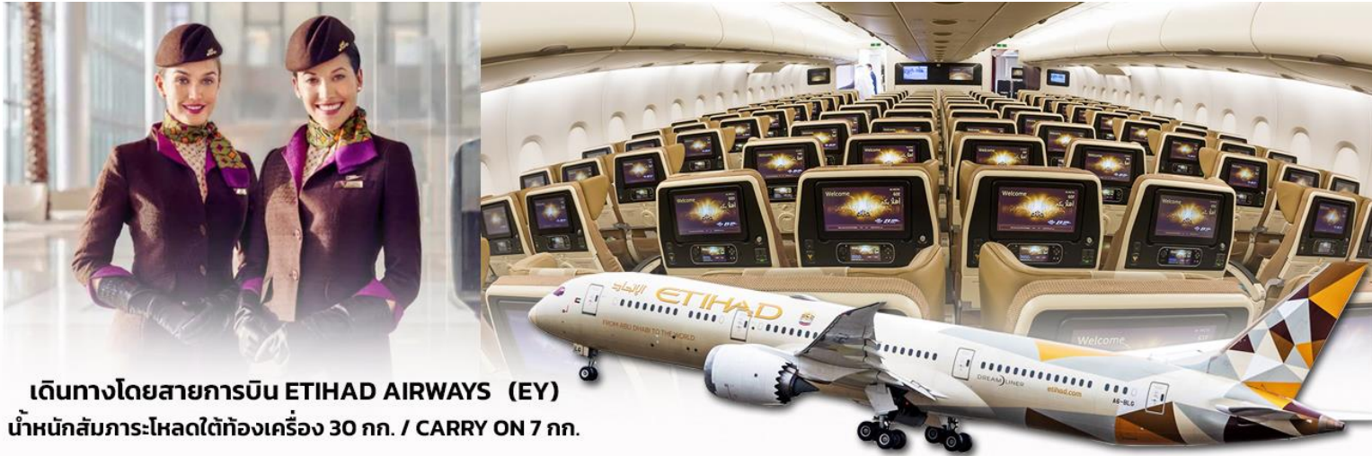
เดินทางโดยสายการบิน ETIHAD AIRWAYS (EY) น้ำหนักสัมภาระโหลดใต้ท้องเครื่อง 30 กก. / CARRY ON 7 กก.