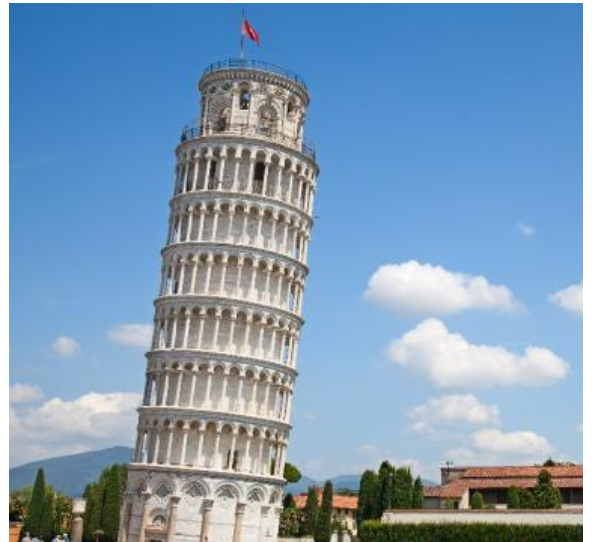
Highlight ! หอเอนปิซาเคยเป็นสถานที่ที่กาลิเลโอมาพิสูจน์เรื่องแรงโน้มถ่วงของโลก และการตกของวัตถุ

นำท่านเก็บภาพความประทับใจและถ่ายรูป 1 ใน 7 สิ่งมหัศจรรย์ของโลก หอเอนปิซา (Leaning Tower of Pisa) หอเอนปิซาที่สร้างขึ้นเพื่อเป็นหอระฆังแห่งวิหารประจำเมือง แต่เพียงการเริ่มต้นของการสร้างถึงบริเวณชั้น 3 ก็เกิดการทรุดตัวและต้องหยุดการก่อสร้างจนถัดมาอีก 100 ปี ถึงได้สร้างต่อจนเสร็จสมบูรณ์ มหาวิหารปิซา (Cathedral of Pisa) มหาวิหารที่สวยงามที่สุดในลักษณะโรมันเนสก์ แสดงให้เห็นจากซายหอคิลจุ่ม กลางตัวมหาวิหาร และขวาหอระฆัง ตัวมหาวิหารเป็นผังกางเขน มีมุขท้ายวัด และตกแต่งซุ้มโค้งรอบวัดภายนอกเป็นแบบแถบหินอ่อน สลับสีทางขวาง ซึ่งกลายมาเป็นแบบที่เรียกว่า "ลักษณะปิซา"และโดมรูปไข่ และ Pisa Baptisty of St. John เป็นอาคารทางศาสนาคริสต์นิกายโรมันคาทอลิก