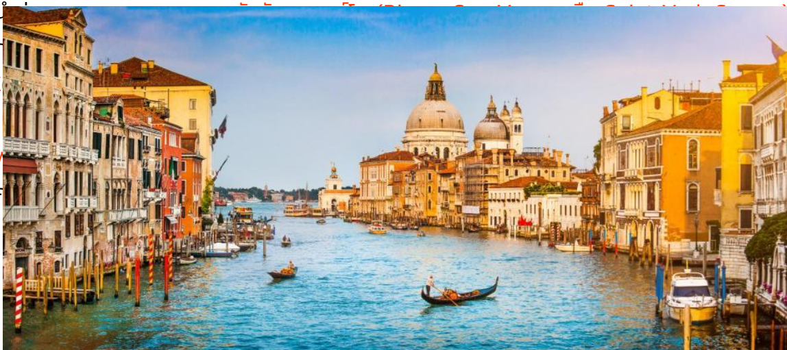
เป็นจัตุรัส สะพานรีอัลโต เดินชมตัวเมืองในสมัยนั้น และเก็บภาพ

นำท่านเดินทางกลับสู่ ท่าเรือตรอนเกตโต้ (ระยะทาง 12 กม. / 30 นาที) เพื่อนำทุกท่านนั่งเรือ จากท่าเรือตรอนเกตโต้สู่ เกาะเวนิส (Venice Island) (ค่าทัวร์รวมค่าล่องเรือไป-กลับแล้ว) ดินแดนแสนโรแมนติก ฉายา ราชินีแห่งทะเลเอเดรียติก เมืองแห่งสายน้ำ เมืองแห่งสะพานและเมืองแห่งแสงสว่าง