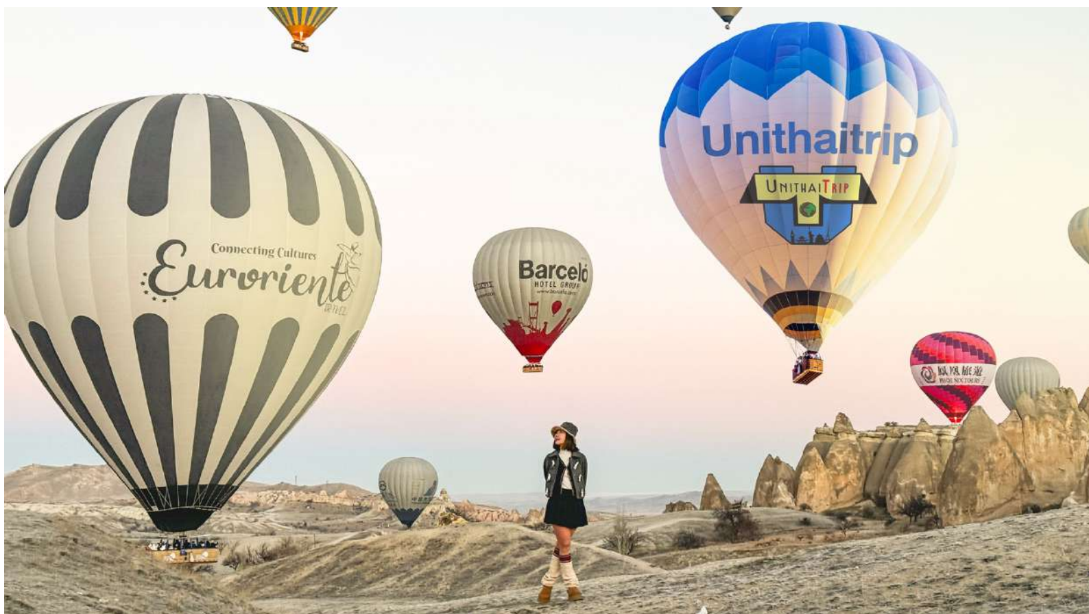
เปิดตัว Balloon UnithaiTrip with K.Music

Option Tour ขึ้นบอลลูนชมเมืองคอปปาโดเกีย (Cappadocia Balloon View) **ราคา 280 USD / คน ขึ้นบอลลูน สัญลักษณ์ของตุรกี ชมพระอาทิตย์ยามเช้า ชมความงามของ เมืองคอปปาโดเกีย พาโนราม่าวิว ชมเมืองอารยธรรมโบราณ เมืองแห่งมนต์เสน่ห์ สัมผัส บรรยากาศมุมสูง เก็บภาพที่สวยงามรอบตัว *การขึ้นบอลลูนขึ้นอยู่กับสภาพอากาศที่ เหมาะสม* โดยจะคำนึงถึงความปลอดภัยของผู้เดินทางเป็นสำคัญ