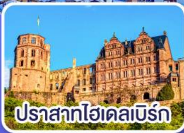
ปราสาทไฮเดลเบิร์ก