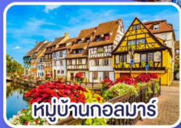
หมู่บ้านกอลมาร์