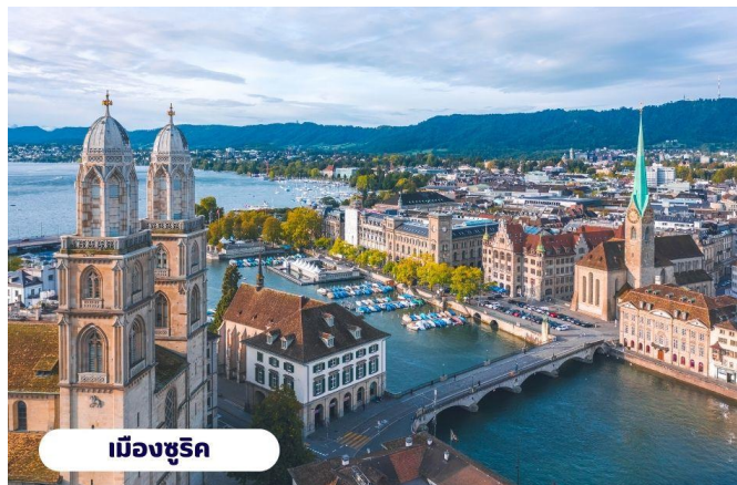
เมืองซูริก

🕒 บริการอาหารกลางวัน ณ ภัตตาคารบนยอดเขา จากนั้นนำท่านลงจากยอดเขาและเดินทางต่อไปยัง เมืองซูริก ใช้เวลาเดินทางประมาณ 1 ชั่วโมง นำท่านเที่ยวชม จัตุรัสพาราเดพลาทซ์ (Paradeplatz) จัตุรัสเก่าแก่ที่มีมาตั้งแต่สมัยศตวรรษที่ 17 ในอดีตเคยเป็นศูนย์กลางของการค้าสัตว์ที่สำคัญของเมืองซูริก ปัจจุบันจัตุรัสนี้ได้กลายเป็นชุมทางรถรางที่สำคัญของเมืองและยังเป็นศูนย์กลางการค้าของย่านธุรกิจ ธนาคาร สถาบันการเงินที่ใหญ่ที่สุดในประเทศ สวิตเซอร์แลนด์ นำท่านแวะถ่ายรูปกับ โบสถ์ฟรอมุน