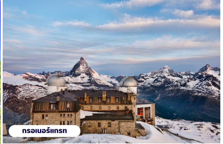
กรอเนอร์กรัท