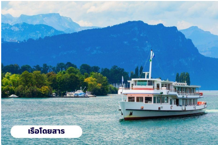
เรือโดยสาร

🕒 บริการอาหารเช้า ณ ห้องอาหารของโรงแรม จากนั้นนำท่านเดินทางสู่ ยอดเขาริกิ (Rigi Kulm) โดยใช้การเดินทางโดยเรือจากทะเลสาบลูเซิร์นไปยังท่าเรือวิทซ์เนา (Vitzanu) จากนั้นนั่งรถไฟไต่เขา Rigi ถือได้ว่าเป็นรถไฟไต่เขาที่เก่าแก่ที่สุดในยุโรป และยังเป็นอันดับ 2 รองจากยอดเขาวอชิงตัน ในมลรัฐนิวแฮมป์เชียร์ สหรัฐอเมริกา ความสูงจากระดับน้ำทะเล 1,797 เมตร จนมาถึงยอดเขาริกิ (Rigi Kulm) ชื่อนี้มีที่มาจากคำว่า Mons Regina แปลได้ว่าราชินีแห่งภูเขา เพราะสามารถมองเห็นทิวทัศน์ของยอดเขาอื่นๆ ได้รอบ 360 องศา ชมวิวแบบพาโนรามาโอบล้อมด้วยธรรมชาติของทะเลสาบ Luzern และ Zug อีสระทุกท่านถ่ายรูปชมวิวตามอัธยาศัย