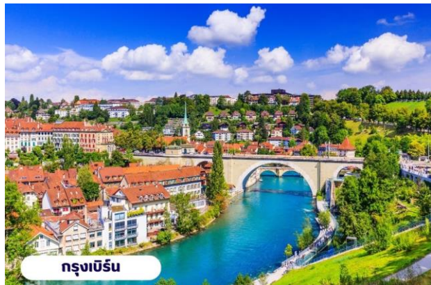
กรุงเบิร์น

☉ บริการอาหารเช้า ณ ห้องอาหารของโรงแรม จากนั้นนำท่านเที่ยวชมสถานที่สำคัญต่างๆในกรุงเบิร์น กรุงเบิร์นได้รับการยกย่องจากองค์การยูเนสโกให้เป็นเมืองมรดกโลก ในปี ค.ศ. 1863 นอกจากนี้เบิร์น ยังถูกจัดอันดับอยู่ใน 1 ใน 10 ของเมืองที่มีคุณภาพชีวิตที่ดีที่สุดในโลกในปี ค.ศ. 2010 นำท่านชม บ่อหมีสีน้ำตาล สัตว์ที่เป็นสัญลักษณ์ของกรุงเบิร์น นำท่านชม มาร์กาสเซ ย่านเมืองเก่า ปัจจุบันเต็มไปด้วยร้านดอกไม้และบูติก เป็นย่านที่ปลอดภัย จึงเหมาะกับการเดินเที่ยวชมอาคารเก่า อายุ 200-300 ปี นำท่านลัดเลาะชม ถนนจุงเคอร์นกาสเซ ถนนที่มีระดับสูงสุดของเมืองนี้ ซึ่งเต็มไปด้วยร้านภาพวาดและร้านขายของเก่าในอาคารโบราณ ชม นาฬิกาใช้ทศลือคเคนทรม อายุ 800 ปี ที่มีโชว์ให้ดูทุกๆชั่วโมงในการตีบอกเวลาแต่ละครั้ง หอนาฬิกานี้ ในช่วงปี ค.ศ. 1191-1256 ใช้เป็นประตูเมืองแห่งแรก ภายหลังได้ดัดแปลงใช้ทศลือคเคนทรมให้กลายมา