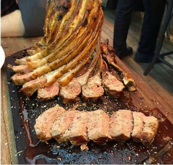
ROCK OF LAMB

สั่งล่วงหน้า เมนูจะหลากหลายกว่าเพราะมาเป็น Portion 1 คน จะได้หลากหลายกว่าไปสั่งเอง