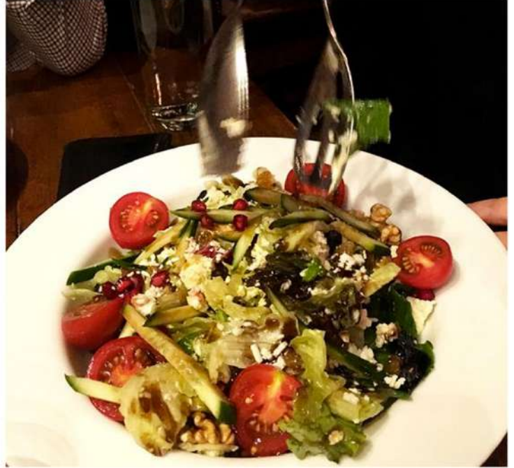
GOAT CHEESE SALAD