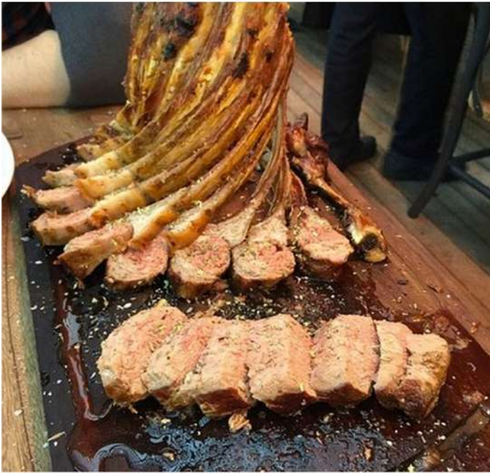
ROCK OF LAMB

สิ่งล่องหน้า เมนูจะหลากหลายกว่าเพราะมาเป็น Portion 1 คน จะได้หลากหลายกว่าไปสั่งเอง