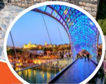
Bridge of Peace