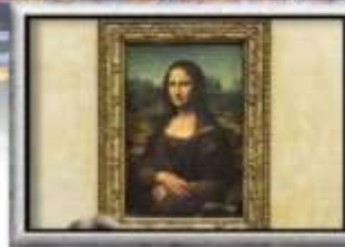
เข้าชมพิพิธภัณฑ์ลูฟวร์