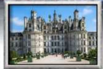
Chateau de Chambord

พิเศษ ทอยแมลงกู่อนไวน์ขาวพร้อมไวน์ พิเศษ ทอยเอสคาโก้ พร้อม ไวน์