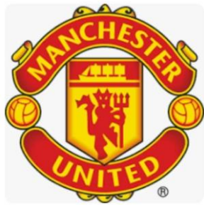
สนาม OLD TRAFFORD

บ่าย อิสระตามอัธยาศัย และ เตรียม ชม การแข่งขันฟุตบอล (ราคาทัวร์ ไม่รวมค่าตั๋วเข้าชมการแข่งขัน)