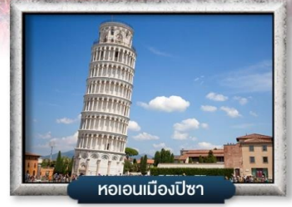
หออนเมืองปิซา

พิเศษ! สปาเกตตี้เส้นหมึกดำ, พิซซ่าสไตล์อิตาลีเปลี่ยนแท้