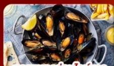
หอยแมลงภู่อูบไวน์ขาว