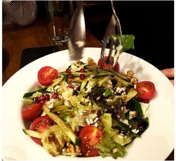
GOAT CHEESE SALAD