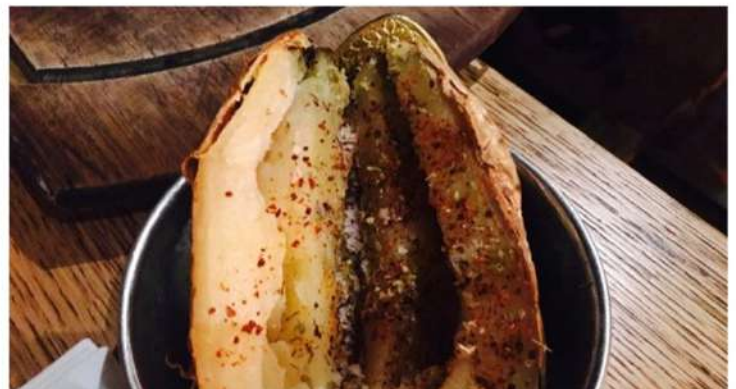
BAKED POTATO OR HOME MADE FRIES