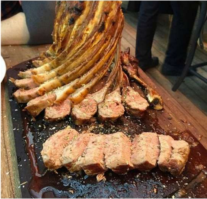
ROCK OF LAMB

สั่งล่วงหน้า เมนูจะหลากหลายกว่าเพราะมาเป็น Portion 1 คน จะได้หลากหลายกว่าไปสั่งเอง