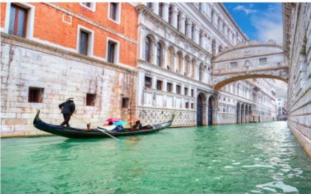
สะพานคอนคายิโอ