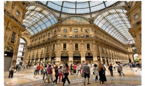
Galleria Vittorio Emanuele II