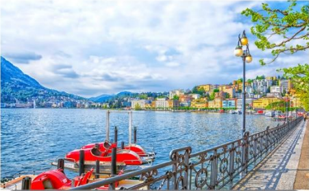
ทะเลสาบลูกาโน