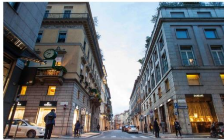
ถนนเฟชั่นมอนเต บโปเลียโน