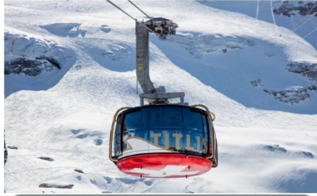
ยอดเขาทิลิส