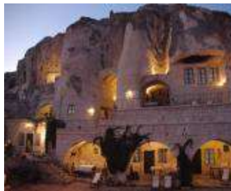
โรงแรมถ้า