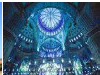
มัสยิดสีน้ำเงิน