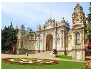
พระราชวังโดลมาบาเซ่