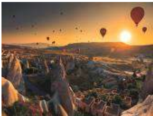
เมืองคปปาโตเกีย