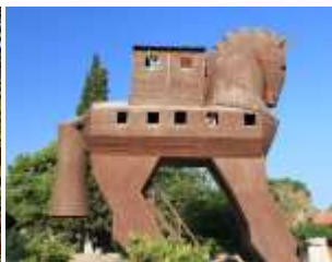
กรุงกรอย