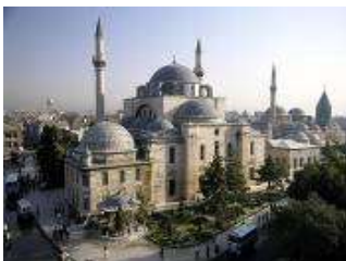
เมืองคอนย่า