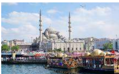
เมืองอิสตันบูล