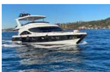
ล่องเรือยอร์ชมช่องแคบบอสฟอรัส