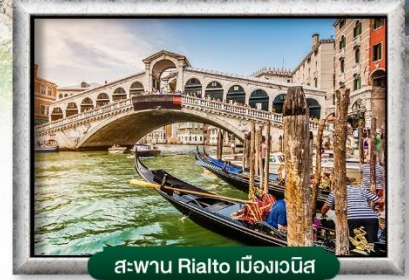
สะพาน Rialto เมืองเวนิส

พิเศษ! หอยเอสคาโก้ + ไวน์แดงฝรั่งเศส | ซิสฟองดูสวิตเซอร์แลนด์ สปาเกี๊ยะดีเส้นหมึกแบบเวนิส