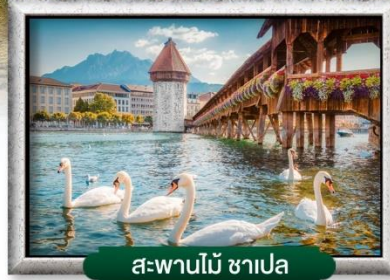
สะพานไม้ ซาเปลา