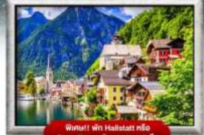
พิน็อค! Win Hallstatt หรือ St. Wolfgang รับประทานอาหาร 1 ที่

พิเศษ!! ลิ้มลองเมนูประจำชาติ ถึง 5 ประเทศ!!!