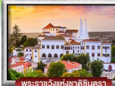
พระราชวังแห่งชาติซันตรา