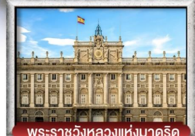
พระราชวังหลวงแห่งมาดริด