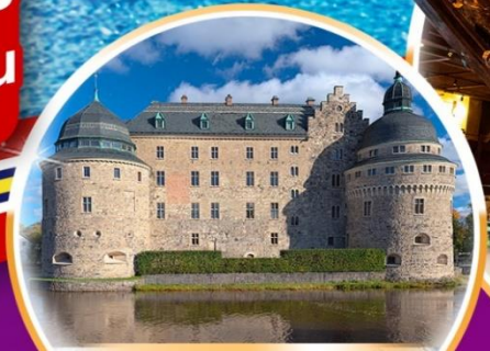
ปราสาทไอโรลุส

รวมทุกอย่าง ไม่ต้องจ่ายหน้างาน *ยกเว้นโรงแรมกักตวง