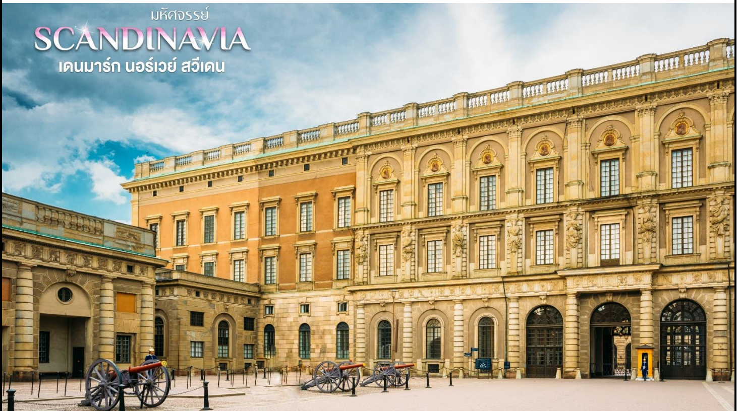
มหัศจรรย์ SCANDINAVIA เดนมาร์ก นอร์เวย์ สวีเดน

นำท่านแวะถ่ายรูปกับ พระราชวังหลวง (Royal Palace) บริเวณแถบพระราชวัง มีตรอกซอกซอยต่าง ๆ เต็มไปด้วยร้านค้ามากมายให้ท่านได้ช้อปปิ้ง ไม่ว่าจะเป็นร้านกาแฟ ร้านอาหาร ร้านของขายที่ระลึก