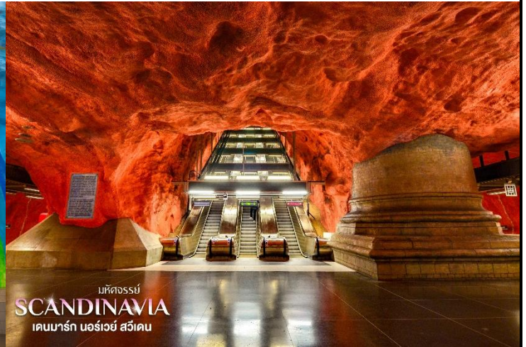
มหัศจรรย์ SCANDINAVIA เดนมาร์ก นอร์เวย์ สวีเดน