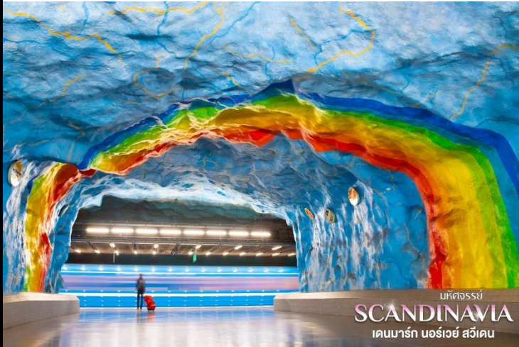
มหัศจรรย์ SCANDINAVIA เดนมาร์ก นอร์เวย์ สวีเดน

จำนวน 100 สถานี โดยเป็นสถานีใต้ดิน 47 สถานี และยกระดับ 53 สถานี มีจำนวน 10 เส้นทาง จัดเป็นกลุ่มสาย 3 กลุ่ม ได้แก่ กลุ่มสายสีน้ำเงิน แดง และเขียว มีระยะทางยาวกว่า 110 กิโลเมตรเลยทีเดียว ซึ่งแต่ละสถานี จะมีความเป็นเอกลักษณ์ มีธีมโดยเฉพาะ ตกแต่งด้วยสีสดใส ลวดลายสวยงาม ทั้งสาย ทั้งนำตื่นตาตื่นใจ ถูกสร้างสรรค์โดยศิลปินกว่า 150 คน