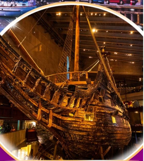
พิพิธภัณฑ์เรือวาซา

มหัศจรรย์ SCANDINAVIA เดนมาร์ก นอร์เวย์ สวีเดน