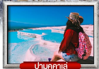
ปานุกคาล์