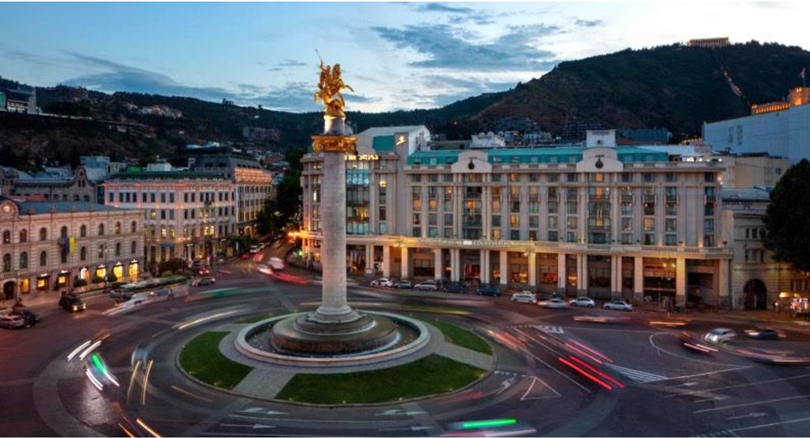
KGG110814-TK จอร์เจีย บาทุმი-ทลิมชี-คาซเบกิ 8วัน5คืน(นอนกูดาวูริ)