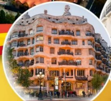
คาสา มิลา