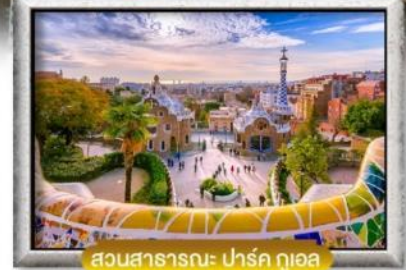
สวนสาธารณะ: ปาร์ก กูเอล

ลิ้มรสหมูหัน ที่ Sobrino de Botín + ข้าวผัดสเปน