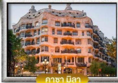
คาซา มิลา