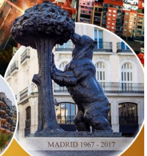
อนุสาวรีย์หมีและต้นสตรอเบอร์รี่