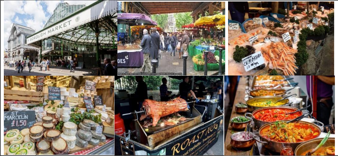
12.00 น. อาหารกลางวัน ณ ภัตตาคาร Burger & Lobster Restaurant (เมนูอาหารพื้นเมือง TBC.)