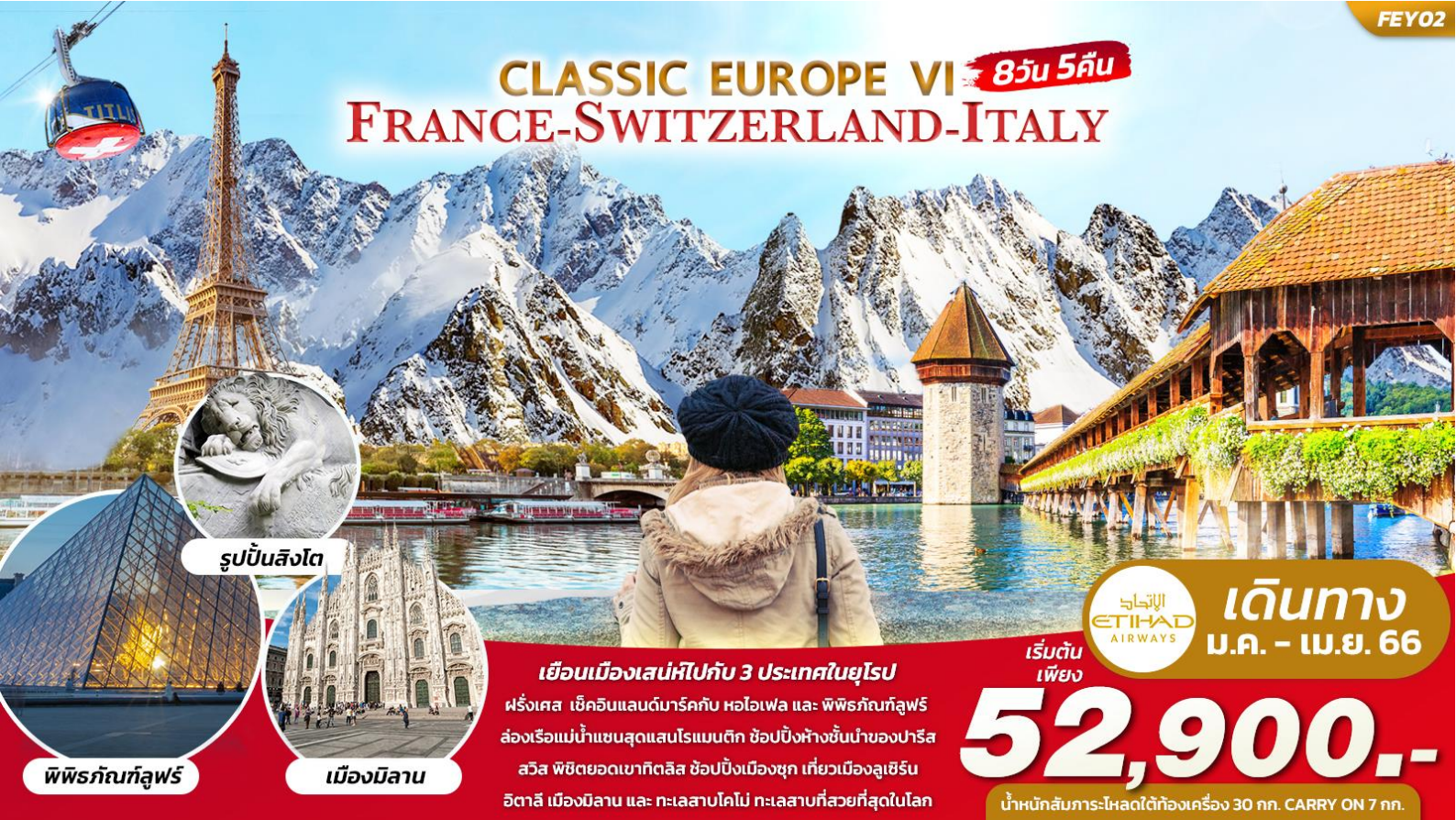
รูปปั้นสิงโต