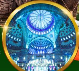
ชมความงดงาม สุเหร่าสีน้ำเงิน