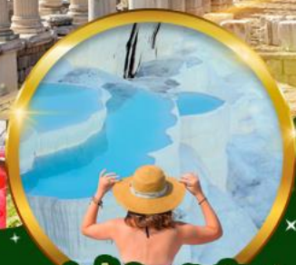
ชมบ่อน้ำร้อนศักดิ์สิทธิ์ ปราสาทปุยฝ้าย