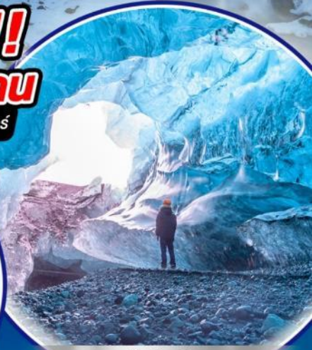
ถ้ำน้ำแข็ง VATNAJOKULL GLACIER