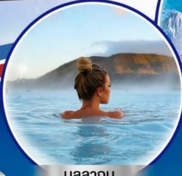
บ่อสุขภาพ

รวมทุกอย่าง!! ไม่ต้องจ่ายหน้างาน วิชา ทิปท้องถิ่น ตัวประกันโรงแรม หอหน้าทัวร์