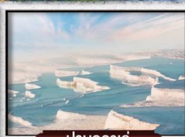
ปามุกคาเล่