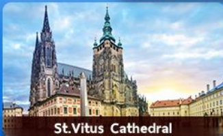
St. Vitus Cathedral