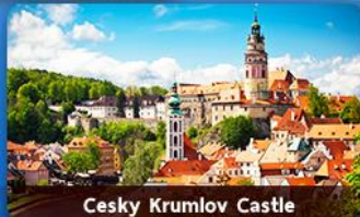
Cesky Krumlov Castle