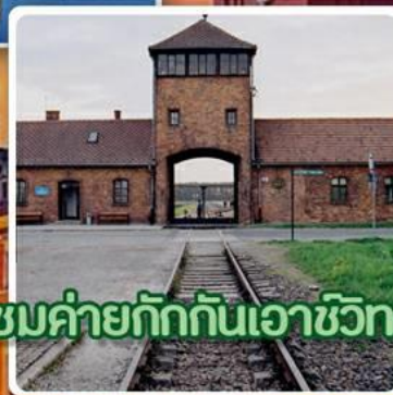
ชมค่ายกักกันเอาชวิตซ์