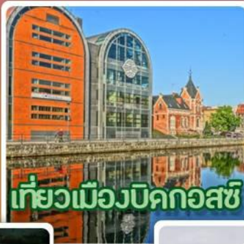
เที่ยวเมืองบิคกอสซี