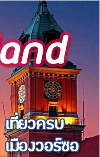
เที่ยวครบ เมืองวอร์ซอ