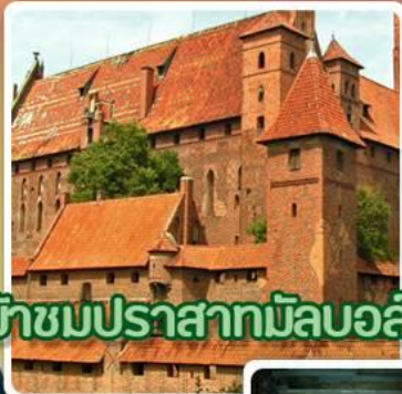
เข้าชมปราสาทมัลบอริก