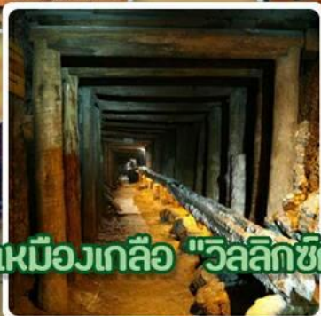
ชมเหมืองเกลือ "วิลลิกซ์กา"