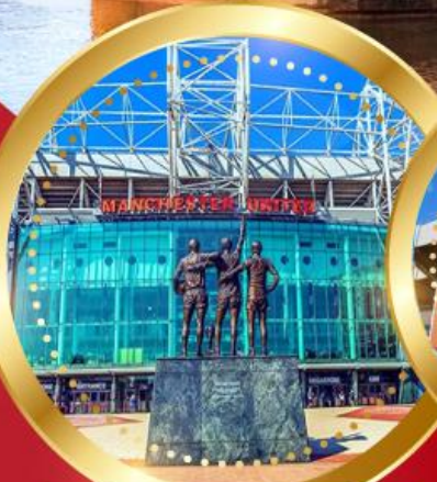
สนามโอลด์แทรฟฟอร์ด