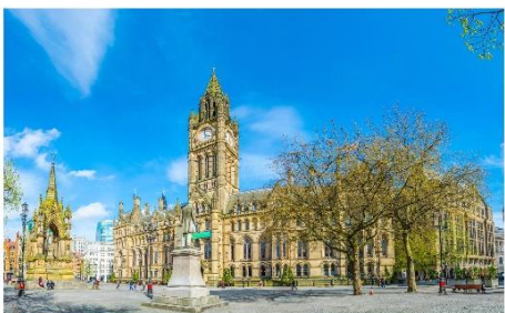
แมนเชสเตอร์