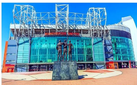
สนามโอลด์แทรฟฟอร์ด