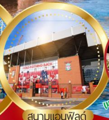
สนามแอนฟิลด์