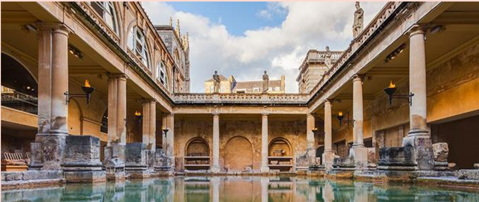
Day 4 Roman Bath – ร้านแซลลี่ - สโตนเฮนจ์ - จัตุรัสกราฟการ์ - ซอปป์ิงแฮร์รอดส์