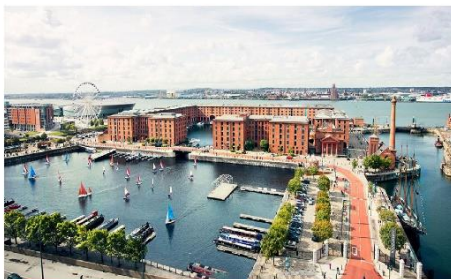
ลิเวอร์พูล