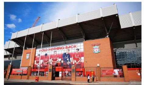
สนามแอนฟิลด์