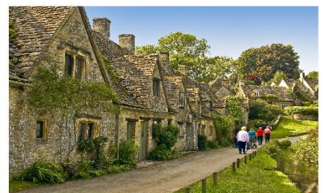
หมู่บ้านโบวีรี่