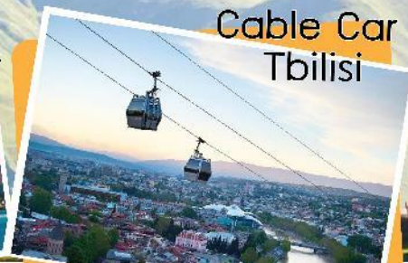
Cable Car Tbilisi