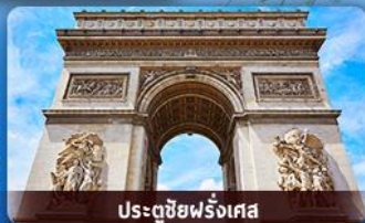
ประตูชัยฝรั่งเศส