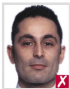
ไกลเกินไป