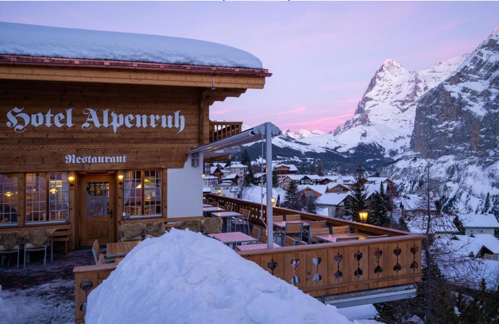
KEU110811-TG สวิตเซอร์แลนด์ 8วัน 5คืน (LUXURY SWISS)