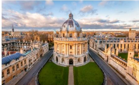
อ็อกฟอร์ด