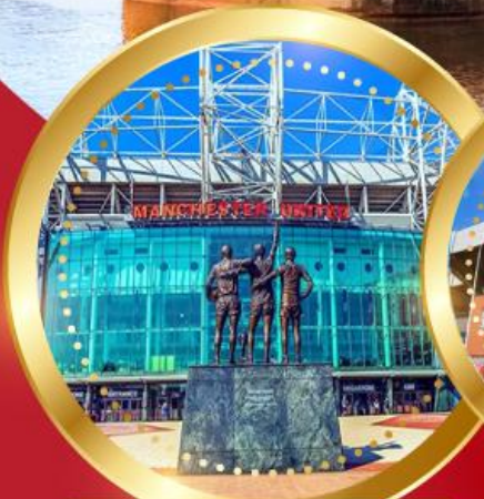
สนามโอลด์แทรฟฟอร์ด