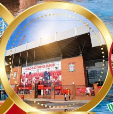
สนามแอนฟิลด์