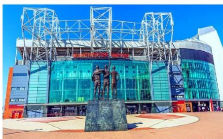
สนามโอลด์แทรฟฟอร์ด