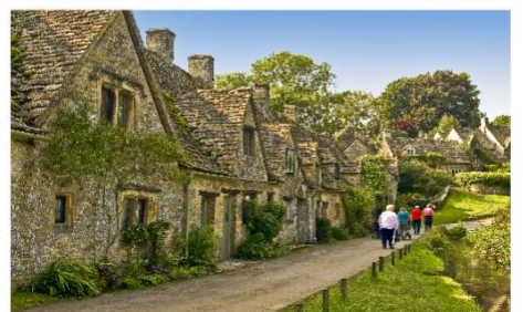
หมู่บ้านโบวีรี่