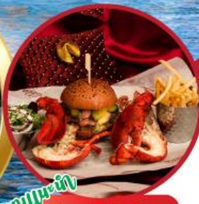
บุฟเฟ่ต์ เบอร์เกอร์&ลือเนสเตอร์