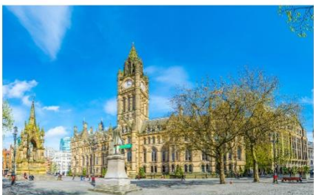
แมนเชสเตอร์