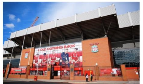
สนามแอนฟิลด์