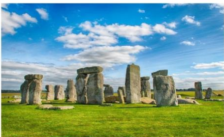
สโตนเฮนจ์