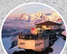
ยอตกเขาซิลอร์น