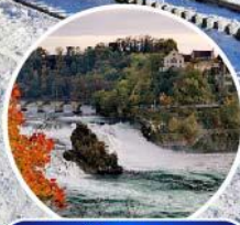
น้ำตกโรส