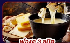
ฟองดู 3 ชนิด

พิเศษ! พักชอแมท เมือง Car Free • น้ำตกไรน์ • เจนีวา • Unseen เมืองชไตน์ อัม ไรน์