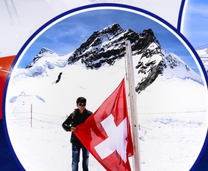
ภูเขาจุงฟรา ใหม่! ขึ้นกระเช้า ลงรถไฟ