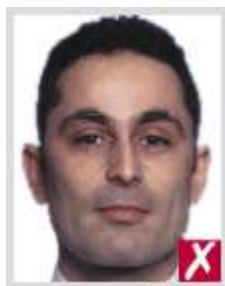
ไกลเกินไป