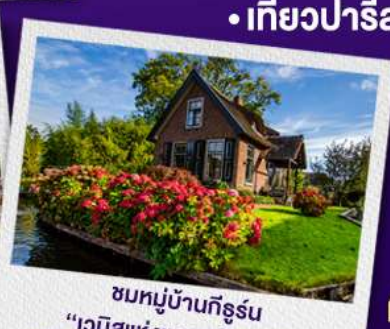
ชมหมู่บ้านที่อรุณ "เวนิสแห่งเนเธอร์แลนด์"