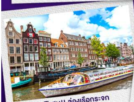
พิเศษ!! ล่องเรือกระจก อัมสเตอร์ดัม