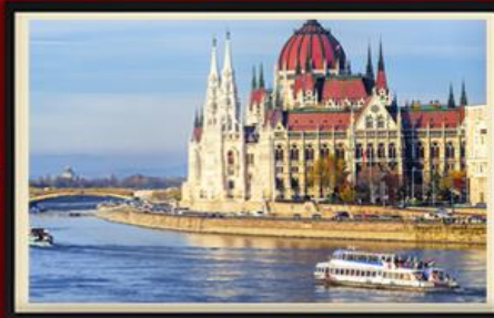
สองเรือแม่น้ำดานูบ

ต้องลอง!! เมนูพิเศษ 3 ประเทศ 3 สไตล์ เปิดอย่างโฮฮีเมียน ซูปลูการ์ช หมุกอเดเวียนนา