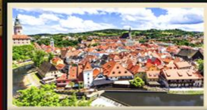
เซสท์คลุมลอฟ