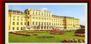
พระราชวังฮินบรุนน์