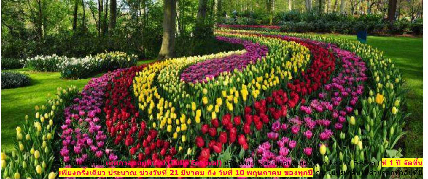
นำท่านเข้าชม เทศกาลดอกทิวลิป (Tulip Festival) หรือ เทศกาลดอกเคอเคินฮอฟ (Keukenhof Festival) ที่ 1 ปี จัดขึ้นเพียงครั้งเดียว ประมาณ ช่วงวันที่ 21 มีนาคม ถึง วันที่ 10 พฤษภาคม ของทุกปี ภายในไร่รอบไร่ด้วยดอกทิวลิปที่มี

เช้า บริการอาหารเช้า ณ ห้องอาหารของโรงแรม นำท่านเดินทางสู่ เมืองลิชเซ่ (Lisse) (ใช้เวลาเดินทางประมาณ 2 ชั่วโมง 10 นาที) เมืองเล็กๆบรรยากาศเหมือนรีสอร์ทของ ประเทศเนเธอร์แลนด์ (Netherlands) ซึ่งเป็นหมู่บ้านที่ประชากรส่วนใหญ่ ประกอบอาชีพเกษตรกรรม เพาะปลูกดอกไม้เมืองหนาวในไร่กว้าง เป็นหลัก