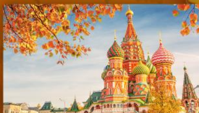
มหาวิหารเซ็นต์ บาซิล