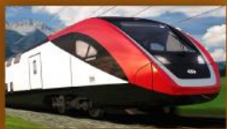
Sapsan Fast Train