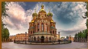
โบสถ์หยดเลือด