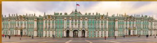
พระราชวังฤดูหนาว