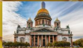
มหาวิหารไอแซค