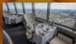
รับประทานอาหารบนตึก Ostankino Tower