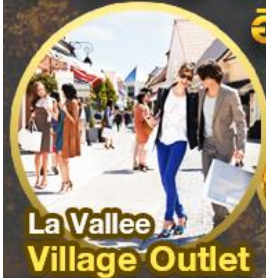
La Vallee Village Outlet

พิเศษ น้ำหนักกระเป๋า 46 กิโล อิสระฟรีเดย์ 1 วันเต็ม