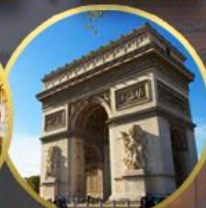
Are de Triomphe

6 วัน 3 คืน PEU 02-KU PRO FRANCE DOUBLE SHOPPING