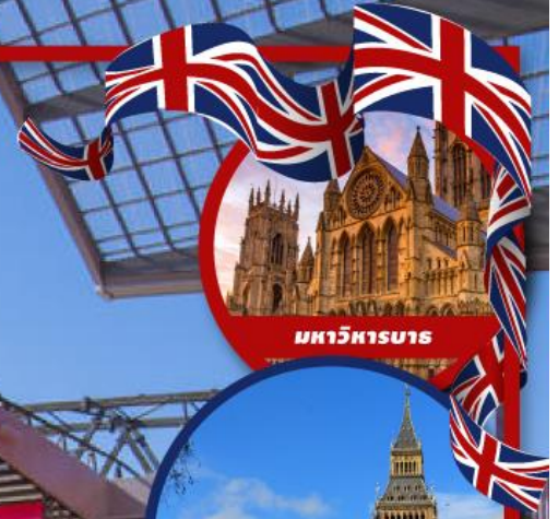
มหาวิหารบาส