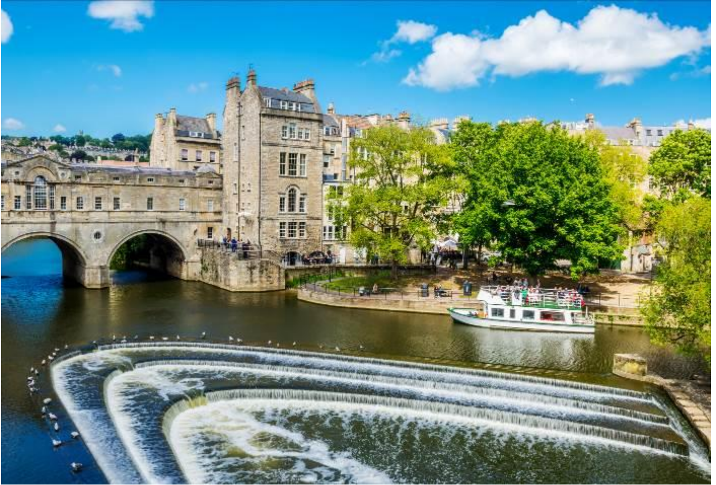
วันที่หก เมืองบาส - มหาวิหารบาส - โรงอาบน้ำโรมันโบราณ - เมืองซาลิสบิวรี - อนุสาวรีย์เสาคอนสตันไทน์ - เมืองลอนดอน (B/-/D)