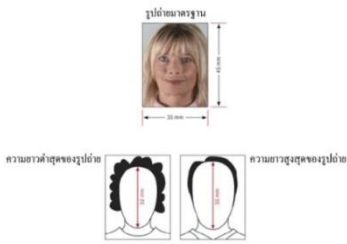
รูปถ่ายมาตรฐาน

2. รูปถ่าย รูปสี่หน้าตรง ฉากหลังสีขาว ขนาด 2x1.5 นิ้ว หรือ 4.5x3.5cm จำนวน 2ใบ รูปถ่ายมีอายุไม่เกิน 3เดือน ห้ามตกแต่งรูป, ห้ามสวมแว่นตา, ห้ามใส่เครื่องประดับ, ห้ามใส่คอนแทคเลนส์ และต้องเป็นรูปที่ถ่ายจากร้านถ่ายรูปเท่านั้น (ใบหน้าใหญ่ ชัดเจน 80% ของขนาดภาพ)